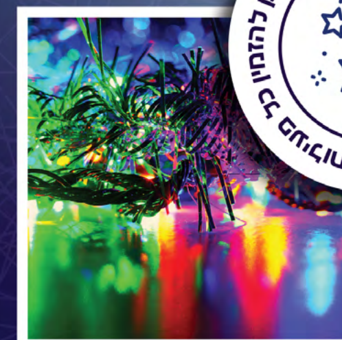
הרקדה באולטרה עם אביזרים זוהרים