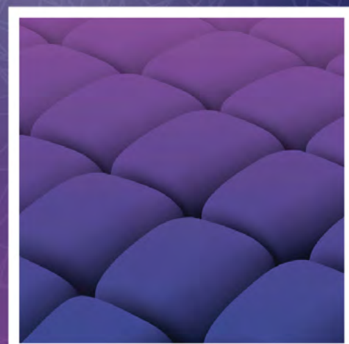
הרקדת מקפצות ייחודית ג'מפינג מאט היחידים בישראל