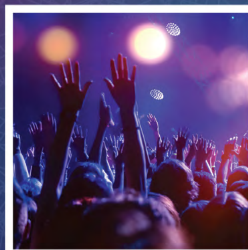
תיפוף והרקדה בשטח פתוח