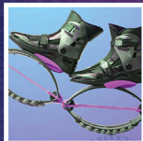
הרקדת נעלי קפיצה היחידים בישראל